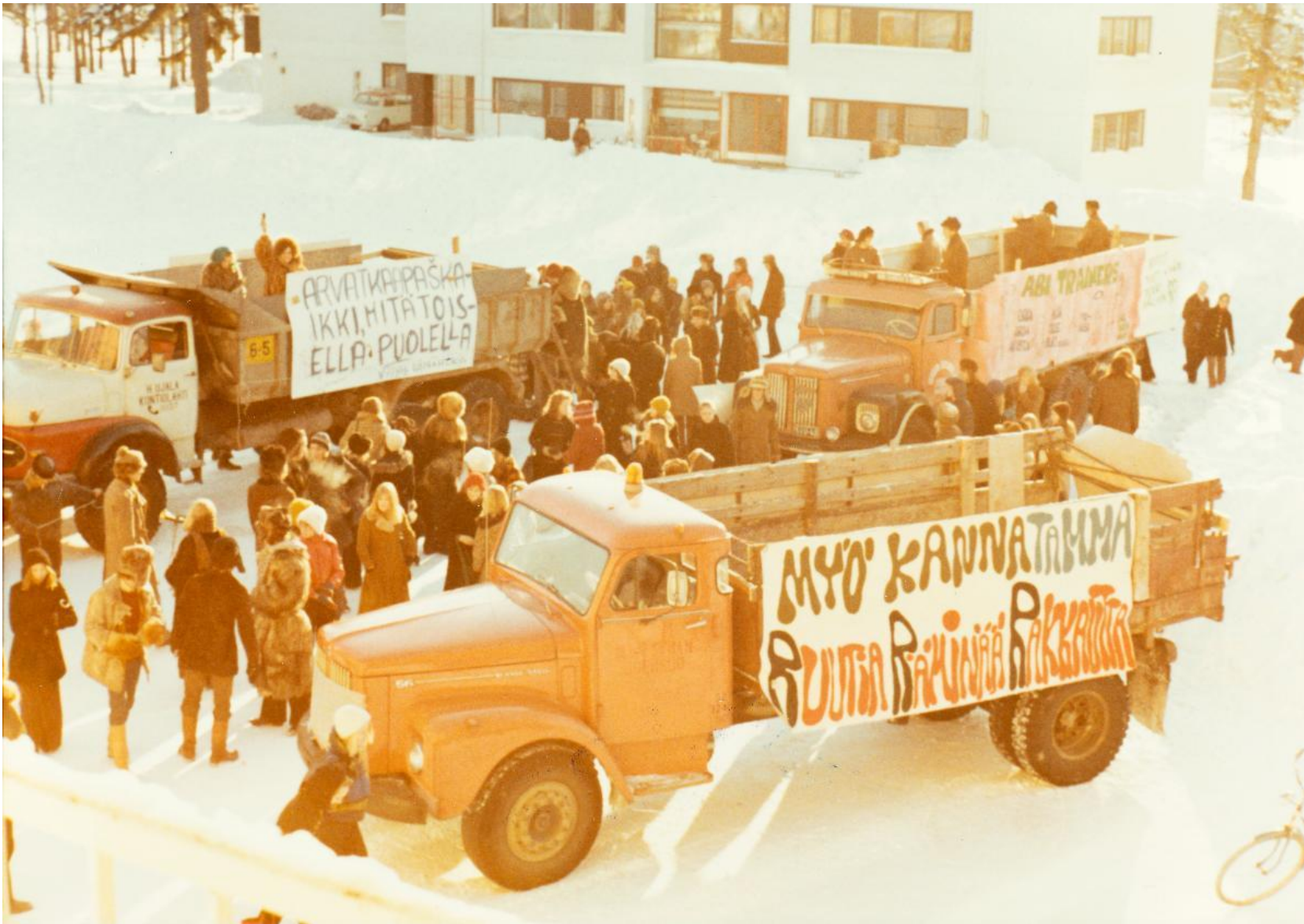
Penkkaritunnelmia Joensuussa vuonna 1972.